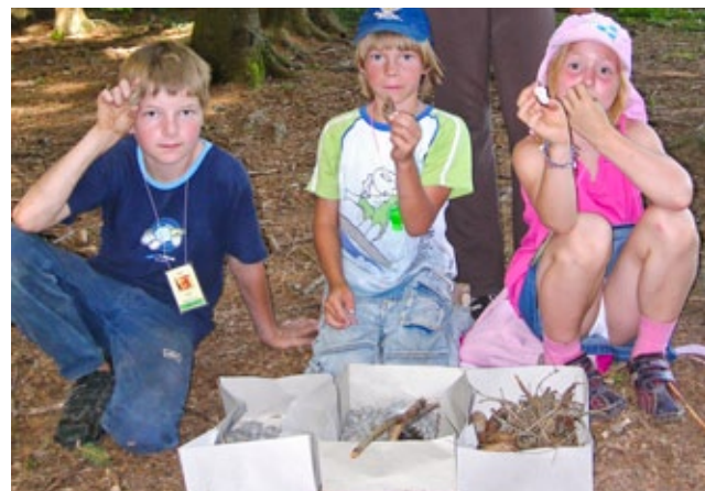
Rohstoffe suchen – gerechte Verteilung?

Alle Dorfteile dürfen nun ihre Funde vorstellen und anpreisen sowie über ihre Erfahrungen beim Sammeln berichten. Besprich mit den Kindern, welche Naturschätze besonders wertvoll für andere Dorfteile sein könnten und welche generell für alle sehr begehrtest seien, da sie selten sind.