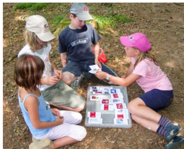
Prioritäten setzen – materielle Reichtümer wichtiger als Gesundheit, Frieden, Familie...?

Du solltest anhand der Ergebnisse der Gruppenarbeit im Gespräch herausarbeiten, dass Lebensqualität offensichtlich weniger von äußeren Faktoren – z. B. materiellem Reichtum – abhängt, sondern dass uns Werte wie ‚Freundschaft‘, ‚Familienzusammenhalt‘, ‚Frieden‘, ‚Gesundheit‘ und ‚saubere Umwelt‘ eigentlich viel wichtiger sind.