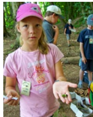
Erdöl suchen – im Spiel sind es Eicheln.

füllen, die es in einer vorgegebenen Zeit (maximal 15 Minuten) finden kann. Die Kinder sollen ihre Kartons als ‚Lastwagen‘ ansehen, die nicht überfüllt werden können (z. B. kleine Stöckchen, kleine Kieselsteine sammeln). Sobald der Karton gefüllt ist, kommt das Kind zu einem vereinbarten Sammelpunkt in seinem Dorfteil zurück. Die Dorfbewohner sollen sich einigen, ob jeder sammelt, was er will, oder ob sie bestimmte